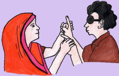
স্পর্শ ইশারা ভাষা

আঙ্গুলের মাধ্যমে বানান বা ফিঙ্গার স্পেলিং