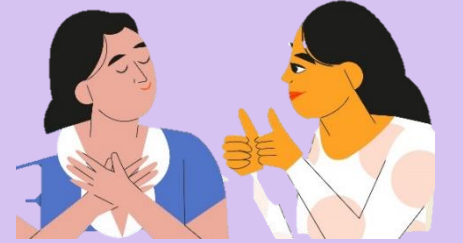
চোখের সামনে ইশারা করা