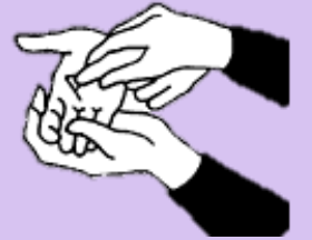
হাতের তালুতে লেখা