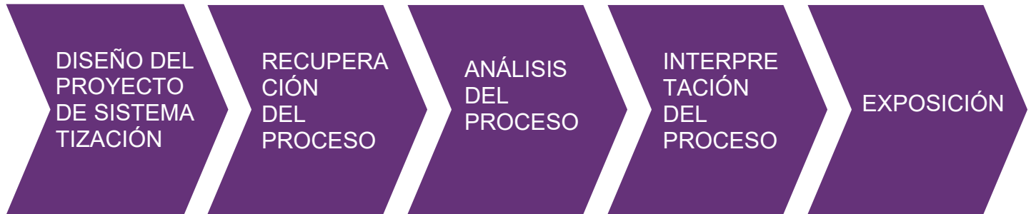
Gráfico N° 01. Etapas del proceso de sistematización

Fuente: Elaboración propia. Adaptado de: Escuela para el desarrollo, 1995.