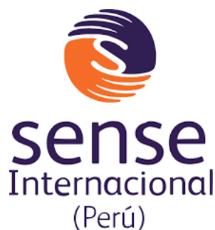
Logo de Sense Internacional Perú (SIP)

Facebook: https://www.facebook.com/asociacionascup?locale=es_LA