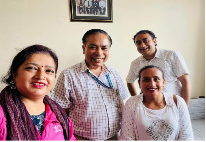
सरकारी कार्यालयमा सूचना तथा संचारमा पहुँच सम्बन्धी लेखाजोखा